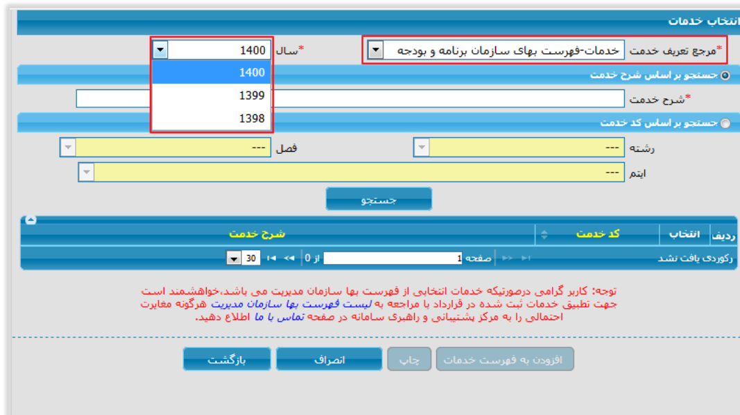
شکل ۲ - انتخاب خدمات

④ در مرحله ثبت فرم خلاصه قرارداد در بخش انتخاب خدمات با انتخاب نوع طبقه‌بندی موضوعی از نوع خدمات - فهرست بهای سازمان برنامه و بودجه و مشاهده می‌شود. این فیلد دارای مقادیر لیست سال‌های دارای فهرست بها بوده و قابل تغییر به سال انتخابی می‌باشد.