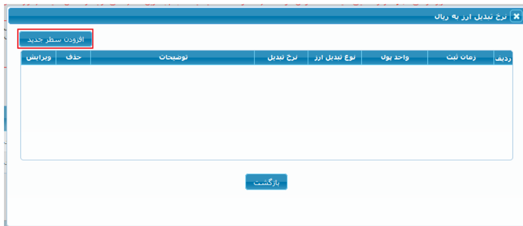
شکل ۱۴ - نرخ تبدیل ارز به ریال

با انتخاب یک یا چندین بار کلید افزودن سطر می‌توانید نرخ تبدیل ارز به ریال را مشخص نمایید تا در زمان بازگشایی پاکت ج، محاسبات بر اساس مقدار تعیین شده صورت پذیرد.