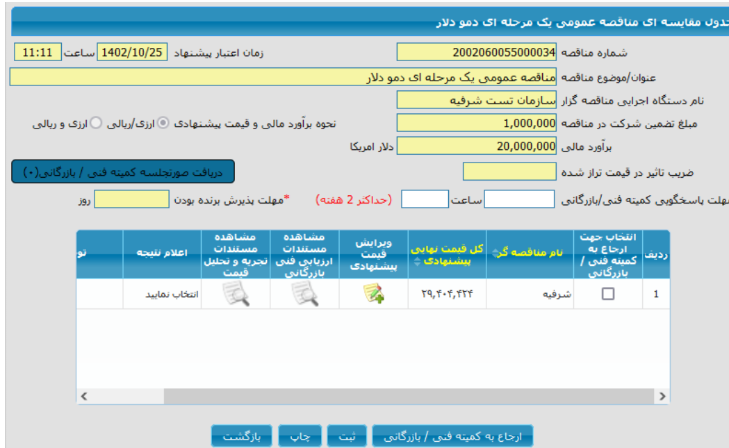
شکل ۱۸ - جدول مقایسه ای - ارزی/ریالی

Ⓜ ستون کل قیمت نهایی پیشنهادی مبلغ ارزی و ریالی محاسبه شده و در این ستون به صورت ریالی نمایش داده می شود.